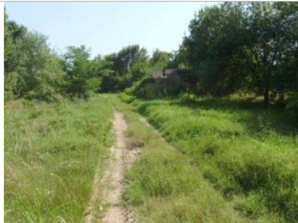
Vue générale

Coordonnées WGS84 : X: 6.67043200 / Y: 43.44422600