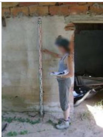
Vue rapprochée - Auteur : EGIS Eau

Altitude calculée de l'eau (en m) : 9.13