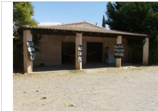
Vue générale - Auteur : EGIS Eau