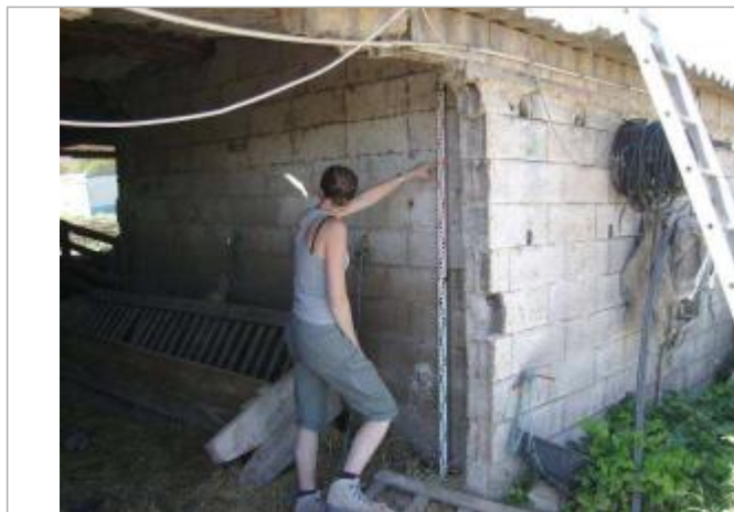
Vue rapprochée - Auteur : EGIS Eau

Altitude calculée de l'eau (en m) : 11.3