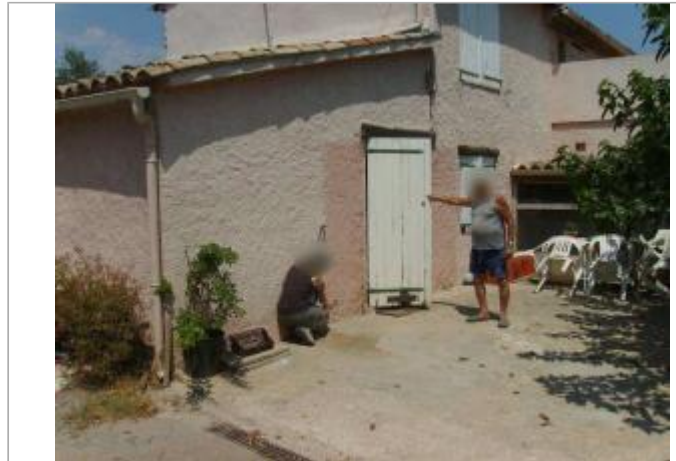
Vue générale - Auteur : EGIS Eau