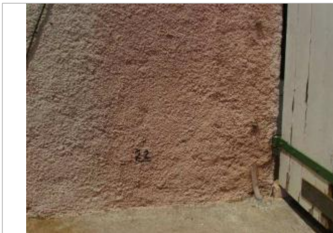
Vue rapprochée - Auteur : EGIS Eau

Altitude calculée de l'eau (en m) : 15.66