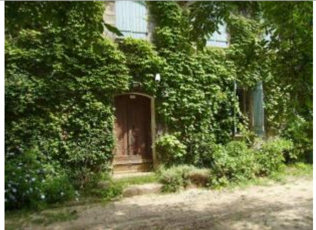
Vue générale - Auteur : EGIS Eau

Coordonnées WGS84 : X: 6.59506800 / Y: 43.46434600