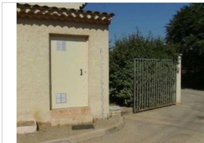
Vue rapprochée - Auteur : EGIS Eau

Code : VAR2010EGA_R_008_1 Date de mise à jour : 04/12/2019 Auteur : Cerema Méditerranée