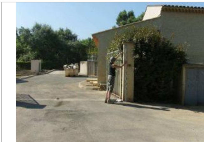
Vue générale - Auteur : EGIS Eau