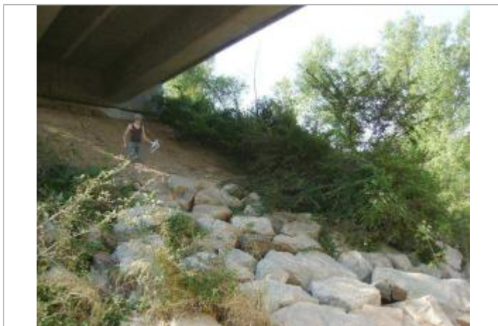
Vue générale - Auteur : EGIS Eau

GÉOLOCALISATION Coordonnées WGS84 : X: 6.56353300 / Y: 43.45271700 Coordonnées RGF93 (Lambert 93) X: 988464.26 / Y: 6268023.11 Coordonnées RGF93 (ETRS89) : X: 6.563533 / Y: 43.452717 Code Hydro: Y5--0200 Rive de référence: Non renseigné