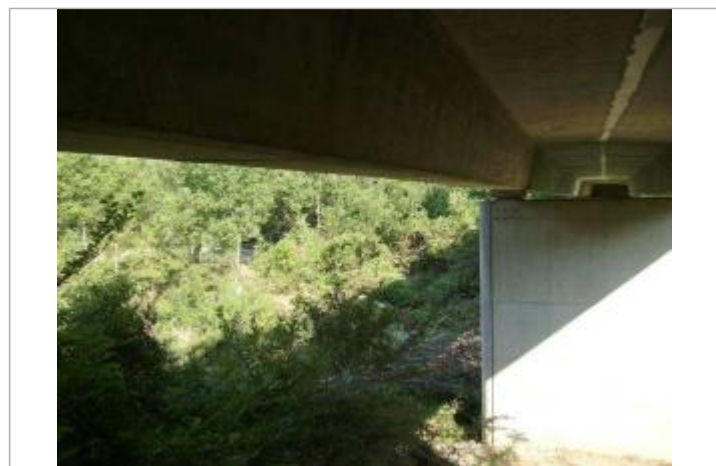
Vue rapprochée - Auteur : EGIS Eau

GÉNÉRAL Code : VAR2010EGA_R_001_1 Date de mise à jour : 04/12/2019 Auteur : Cerema Méditerranée