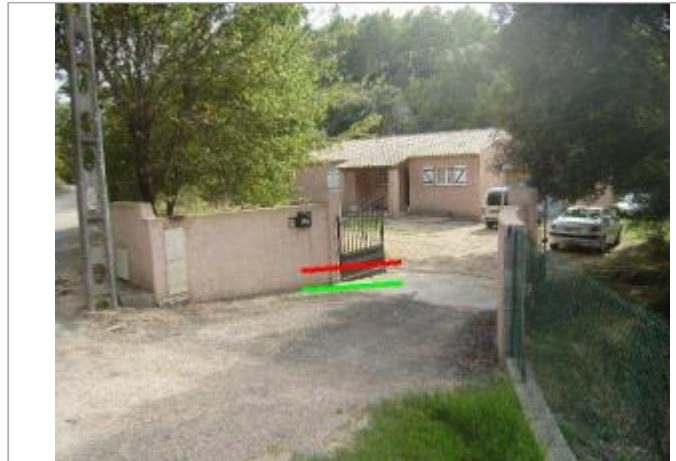
Vue générale - Auteur : GINGER

Coordonnées WGS84 : X: 6.38895530 / Y: 43.42037790