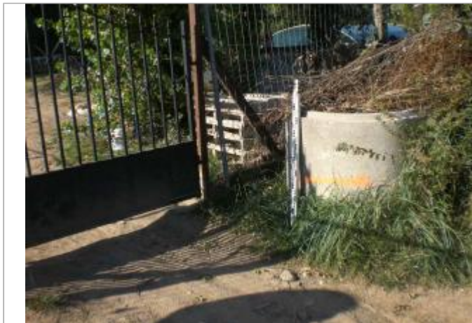
Vue générale - Auteur : GINGER

Coordonnées WGS84 : X: 6.49394350 / Y: 43.49645580