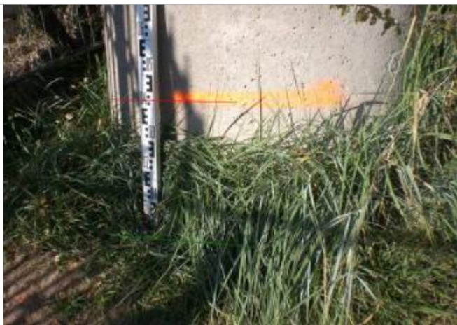
Vue rapprochée - Auteur : GINGER

Altitude calculée de l'eau (en m) : 110.399 m