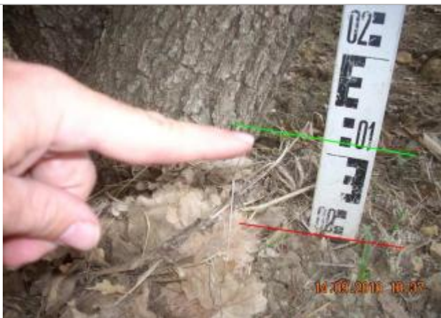
Vue rapprochée - Auteur : GINGER

Altitude calculée de l'eau (en m) : 166.811 m