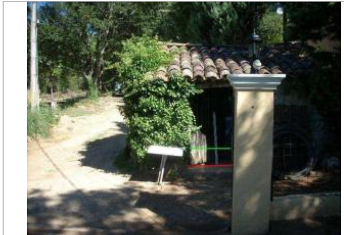
Vue générale - Auteur : GINGER

Coordonnées WGS84 : X: 6.39969160 / Y: 43.49892440