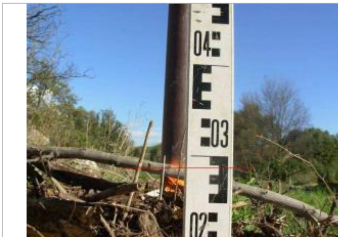
Vue rapprochée - Auteur : GINGER

Altitude calculée de l'eau (en m) : 242.797 m