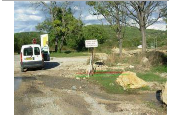
Vue générale - Auteur : GINGER