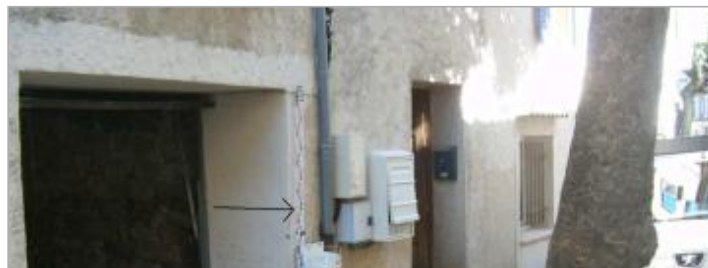
Vue générale - Auteur : GINGER