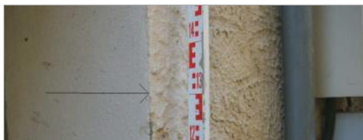
Vue rapprochée - Auteur : GINGER