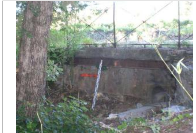
Vue générale - Auteur : GINGER