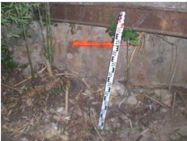
Vue rapprochée

Altitude calculée de l'eau (en m) : 207.313 m