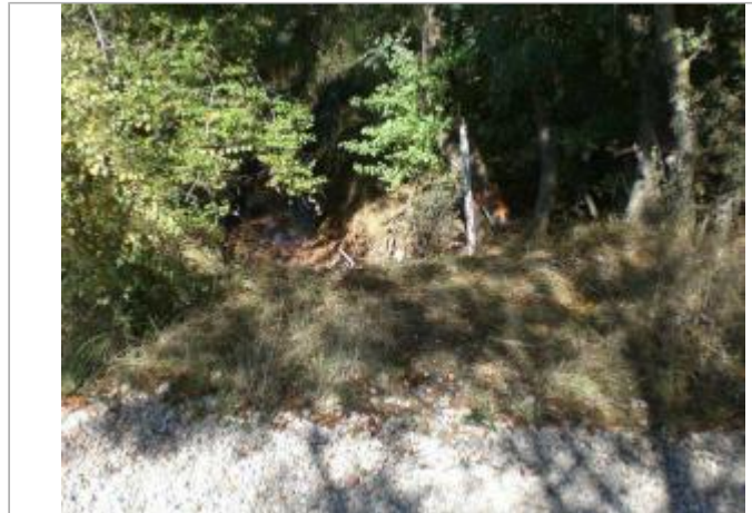
Vue générale - Auteur : GINGER