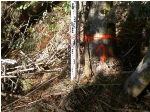
Vue rapprochée - Auteur : GINGER

Altitude calculée de l'eau (en m) : 79.562 m