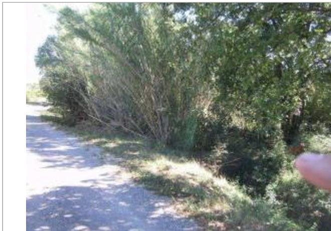
Vue générale - Auteur : GINGER