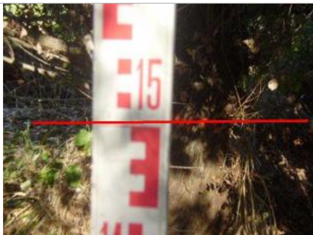
Vue rapprochée - Auteur : GINGER

Altitude calculée de l'eau (en m) : 72.966