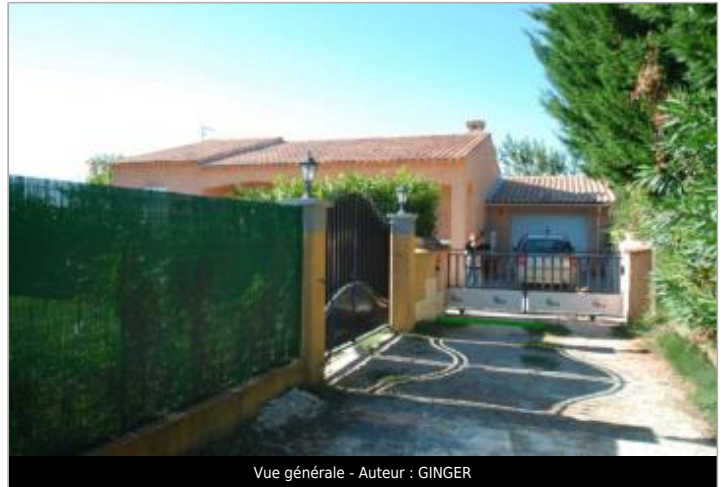
Vue générale - Auteur : GINGER

Coordonnées WGS84 : X: 6.42066990 / Y: 43.41850010