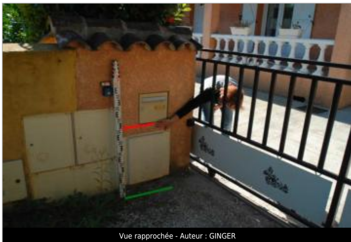
Vue rapprochée - Auteur : GINGER

Altitude calculée de l'eau (en m) : 54.869