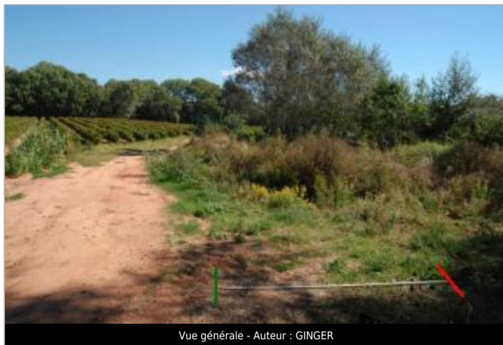
Vue générale - Auteur : GINGER