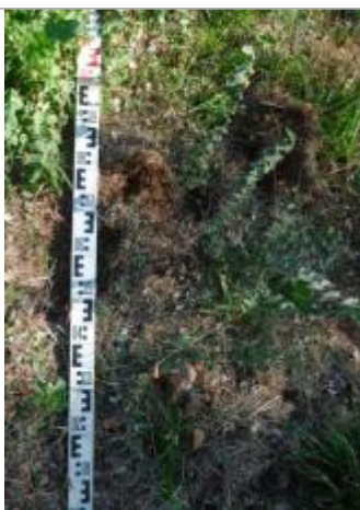
Vue rapprochée

Altitude calculée de l'eau (en m) : 48.061