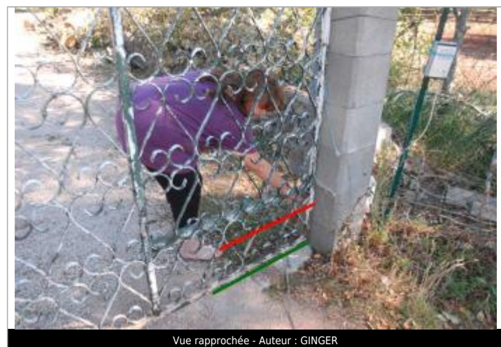
Vue rapprochée - Auteur : GINGER