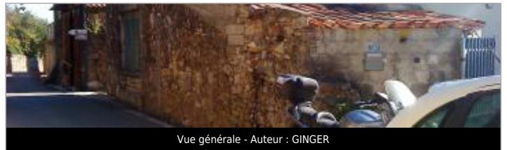
Vue générale - Auteur : GINGER