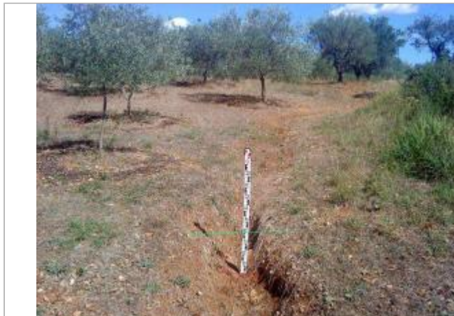
Vue générale - Auteur : GINGER