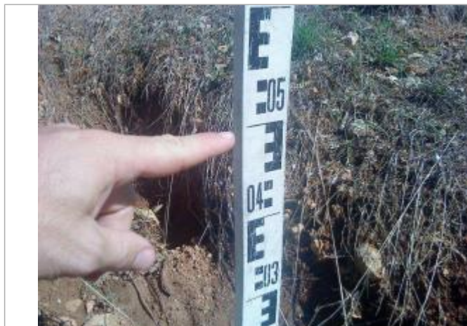
Vue rapprochée - Auteur : GINGER

Altitude calculée de l'eau (en m) : 232.935