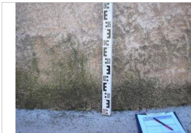
Vue rapprochée - Auteur : GINGER

Altitude calculée de l'eau (en m) : 297.81