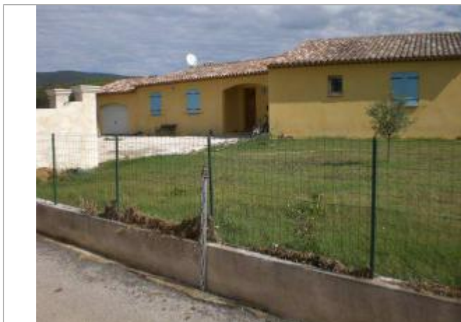
Vue générale - Auteur : GINGER