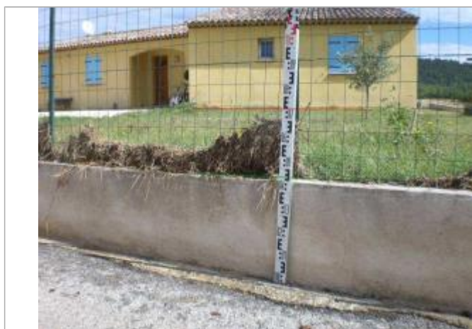
Vue rapprochée - Auteur : GINGER

Code : VAR2010GI_R_365_1 Date de mise à jour : Auteur : Cerema Méditerranée 01/02/2021