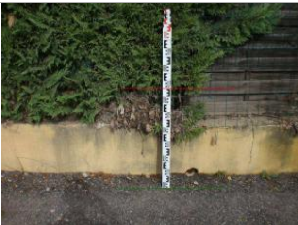
Vue rapprochée - Auteur : GINGER

Altitude calculée de l'eau (en m) : 252.248