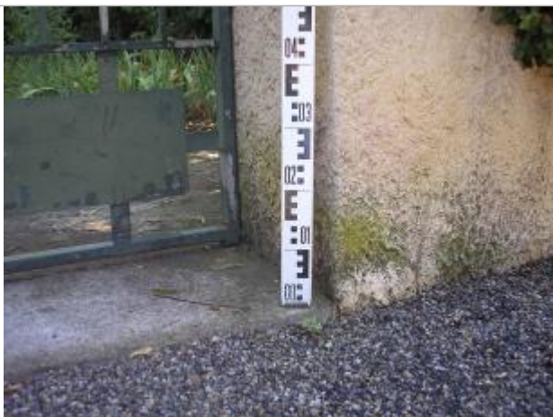
Vue rapprochée - Auteur : GINGER

Altitude calculée de l'eau (en m) : 181.39