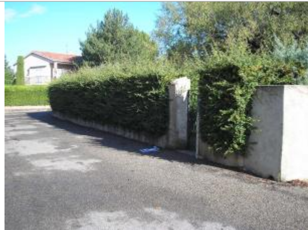
Vue générale - Auteur : GINGER