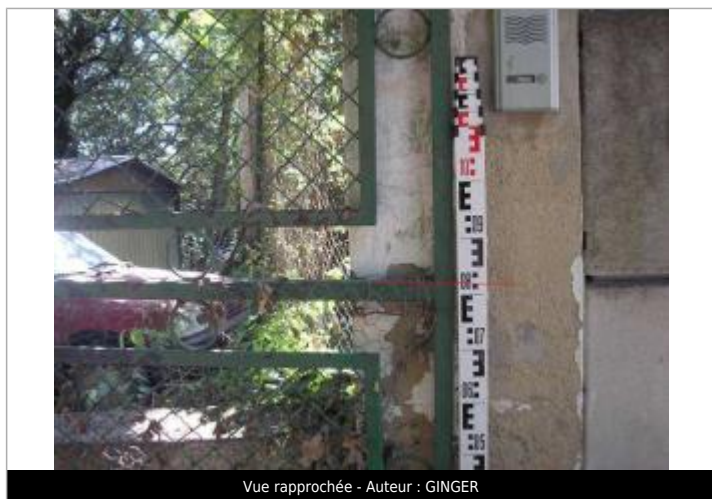
Vue rapprochée - Auteur : GINGER

Altitude calculée de l'eau (en m) : 226.348