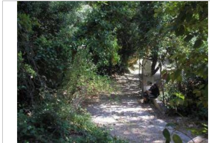
Vue générale - Auteur : GINGER