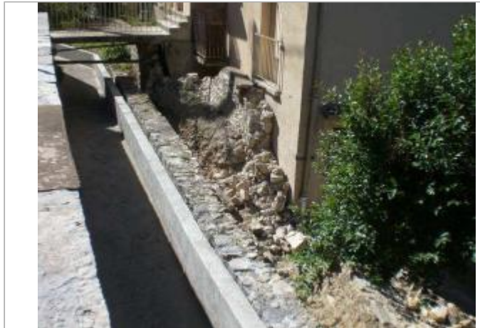
Vue générale - Auteur : GINGER