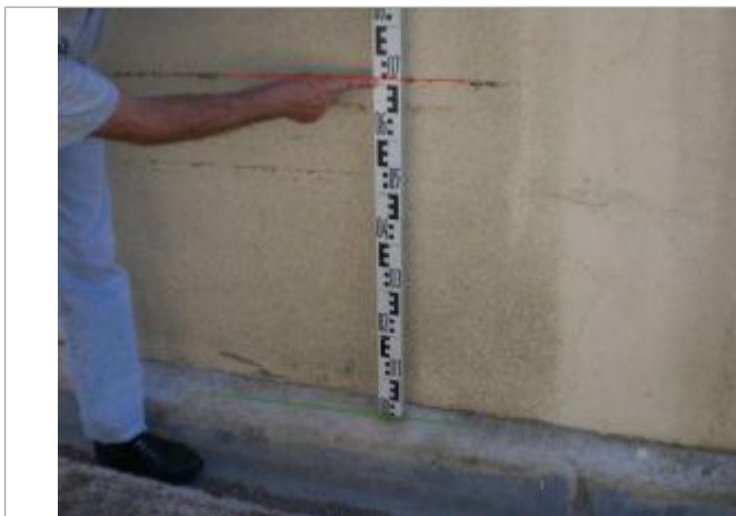
Vue rapprochée - Auteur : GINGER

Altitude calculée de l'eau (en m) : 191.269