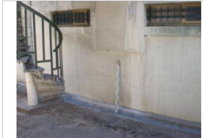
Vue générale - Auteur : GINGER