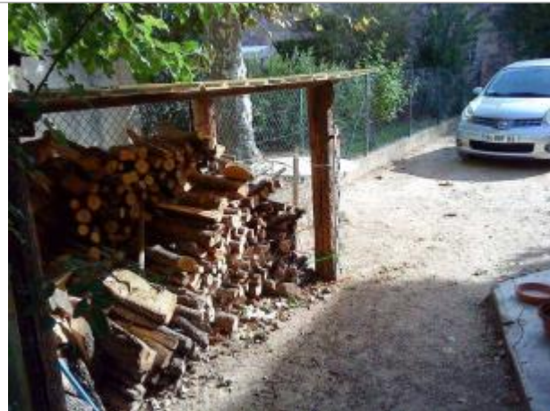
Vue générale - Auteur : GINGER