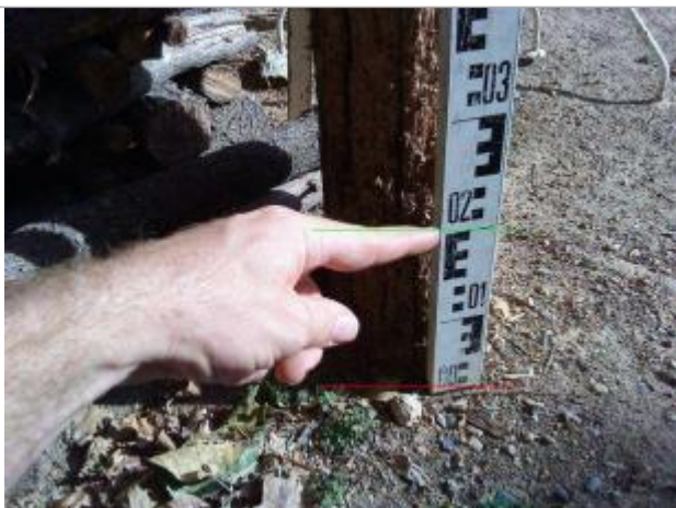
Vue rapprochée

Altitude calculée de l'eau (en m) : 132.201