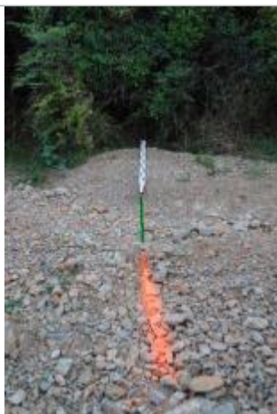
Vue rapprochée - Auteur : GINGER

Altitude calculée de l'eau (en m) : 63.167