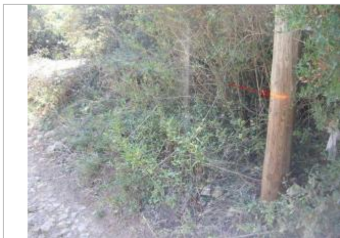
Vue rapprochée - Auteur : GINGER