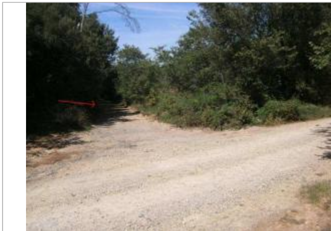
Vue générale - Auteur : GINGER