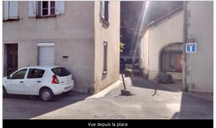
Vue depuis la place

GÉOLOCALISATION Coordonnées WGS84 : X: 1.97028390 / Y: 44.14324200 Coordonnées RGF93 (Lambert 93) X: 617620.27 / Y: 6338785.59 Coordonnées RGF93 (ETRS89) : X: 1.9702839 / Y: 44.143242 Code Hydro: 05--0290 Rive de référence: