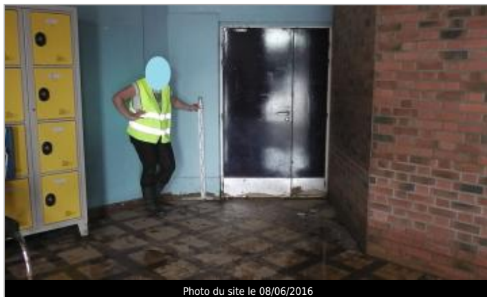
Photo du site le 08/06/2016

Coordonnées WGS84 : X: 2.48836500 / Y: 50.15736200