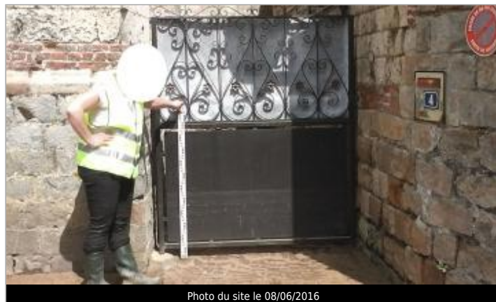
Photo du site le 08/06/2016