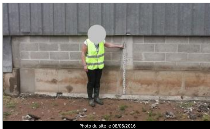
Photo du site le 08/06/2016