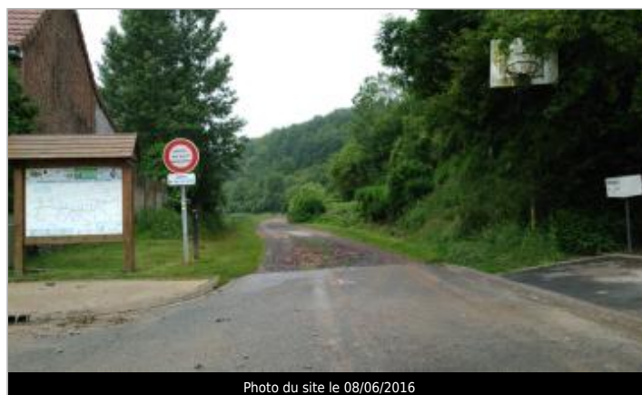
Photo du site le 08/06/2016