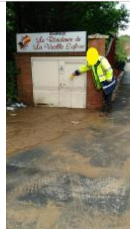
Photo du site le 08/06/2016