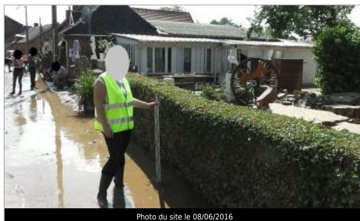
Photo du site le 08/06/2016