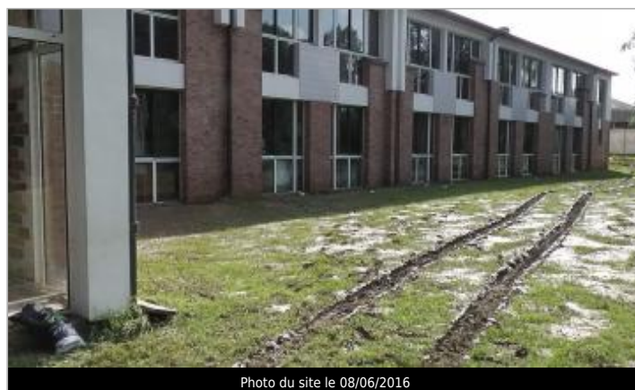
Photo du site le 08/06/2016