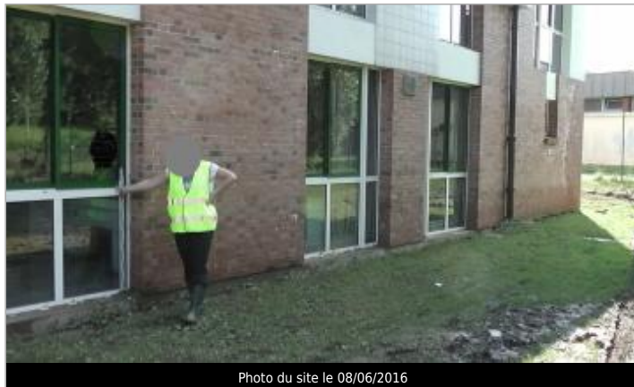
Photo du site le 08/06/2016

Coordonnées WGS84 : X: 2.48760100 / Y: 50.15777500