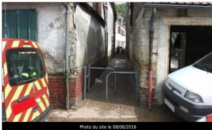
Photo du site le 08/06/2016