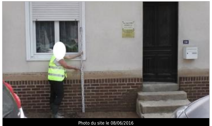
Photo du site le 08/06/2016

Coordonnées WGS84 : X: 2.49319600 / Y: 50.15493900