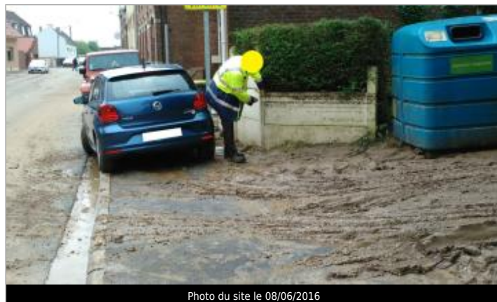
Photo du site le 08/06/2016