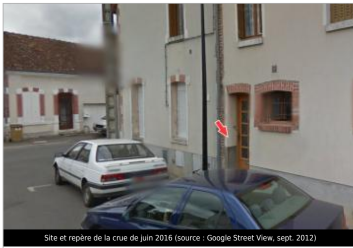
Site et repère de la crue de juin 2016