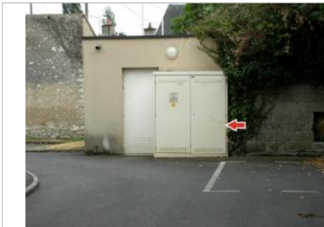
Repère de la crue de juin 2016

Altitude calculée de l'eau (en m) : 87.27 m