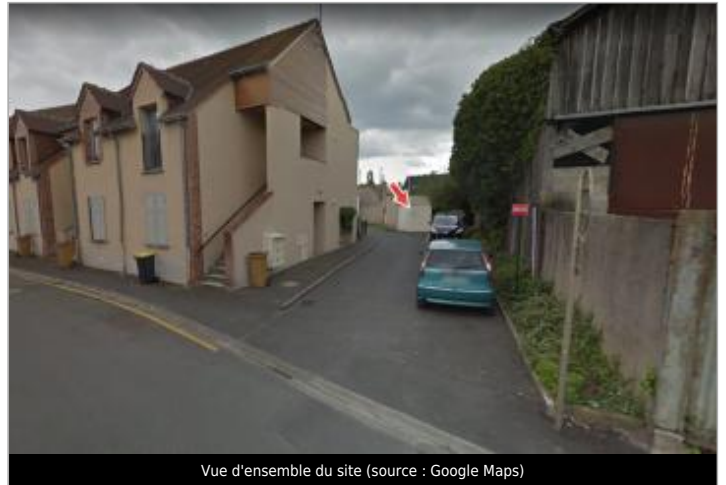
Vue d'ensemble du site

Coordonnées WGS84 : X: 1.74117300 / Y: 47.35362700