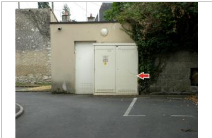
Repère de la crue de juin 2016

MARQUE Maximum de l'inondation : Oui Visibilité : Oui État du repère : Disparu Pérennité : Aucune