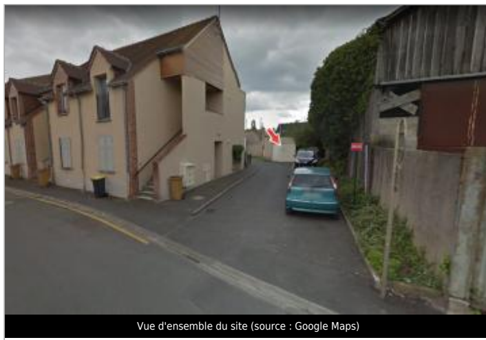
Vue d'ensemble du site