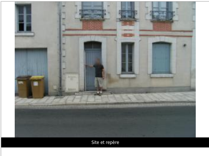
Site et repère