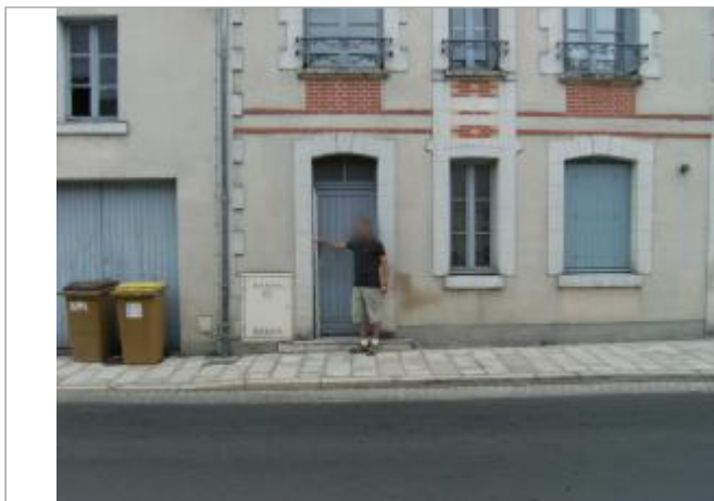
Site et repère

Coordonnées WGS84 : X: 1.74274600 / Y: 47.35440200