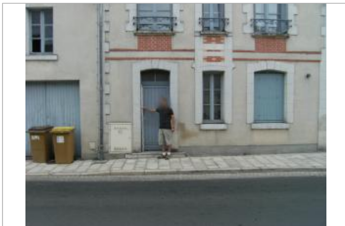
Site et repère