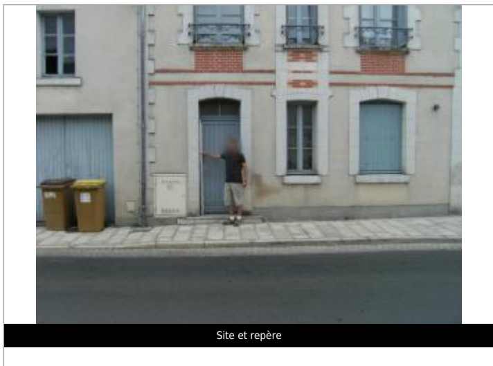
Site et repère