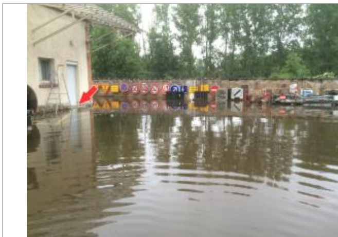
Site pendant la crue de juin 2016