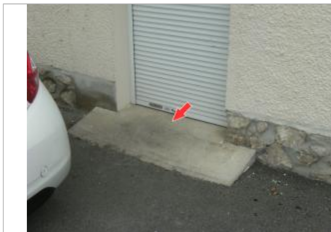
Détail du repère de la crue de juin 2016